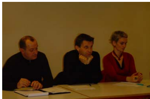
L'équipe de consultants du Cabinet